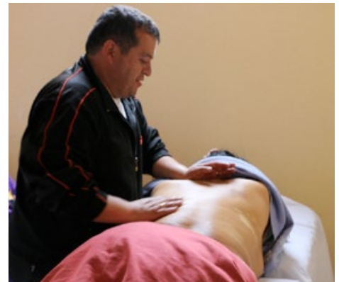
Behandlung durch den Physiotherapeuten

Eine dieser Anstrengungen betraf vor allem das Physiotherapiezentrum. Dieses Zentrum wurde von seinen Voluntario-Freunden schon seit Januar 2016 geplant und organisiert, um die gesundheitliche Situation der Menschen mit Behinderung unmittelbar verbessern zu können. Seitdem haben sie ausgiebig mit der Stadtverwaltung und der NGO Yanapasun verhandelt und Mitte Januar 2017 konnte das Zentrum schließlich in Kooperation mit der Asociación Yanapasun seinen Betrieb aufnehmen. Für die Zukunft ist nun auch noch die Kooperation mit der Stadtverwaltung geplant. Bereits jetzt werden im Zentrum an jedem Werktag vormittags zwischen fünf und zehn Menschen mit Behinderung durch einen professionellen Physiotherapeuten und ein bis zwei Freiwillige unter seiner Anleitung behandelt. Dass diese Arbeit Früchte trägt, zeigt vor allem der Fall eines Patienten des Zentrums: Während er sich vorher nur mit zwei Unterarmgehstützen fortbewegen konnte, reicht ihm inzwischen nur noch ein Gehstock. Durch diese Verbesserung konnte er sogar schon wieder einen Arbeitsplatz finden!