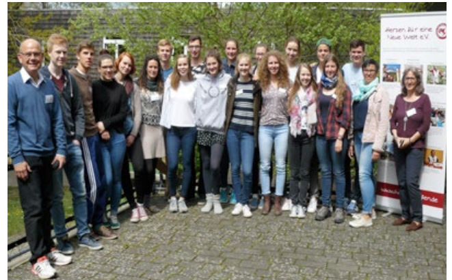
Neue Freiwillige und Vorstandsmitglieder beim Vorbereitungsseminar