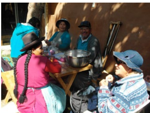
Wöchentliche Koch- und Strick-Workshops

Neben dem Physiotherapiezentrum gehören zum Projekt „Suyana Sonqo“ schon immer zwei Workshops, welche jeweils einmal wöchentlich im Garten der Oficina, der peruanischen Geschäftsstelle, stattfinden: der Koch- und der Strickworkshop. Diese beiden Workshops wurden im Laufe der letzten Monate umstrukturiert. Neben dem Ziel, die Menschen mit Behinderung dadurch zu motivieren, aus ihren Häusern herauszukommen und sich mit anderen auszutauschen, will das „Suyana Sonqo“ mit dem neuen Konzept auch ihre Selbstständigkeit stärken. So beschränken sich die Workshops nicht mehr auf das gemeinsame Kochen oder Stricken, sondern die hergestellten Produkte sollen auch mit und besonders von den Menschen mit Behinderung verkauft werden. Deshalb gehen die Freiwilligen jeden Mittwoch mit den Teilnehmenden auf die Straße oder