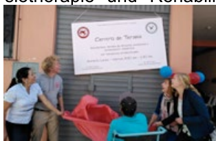
Eröffnung des Physiotherapiezentrums

Einweihung des Physiotherapiezentrums: Am 9. Juni 2017 wurde das Physiotherapiezentrum, in dem nun Physiotherapie und Rehabilitationsbehandlungen für Menschen mit Behinderungen angeboten werden, eingeweiht. Das Zentrum wird von Corazones para Perú in Zusammenarbeit mit der Organisation Yanapasun geführt.