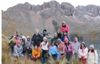
Wanderung zum Chicón-Gletscher

Wanderung zum Gletscher: Es ist mittlerweile zur Tradition unter den Freiwilligen geworden, zumindest einmal den direkt hinter Munaychay gelegenen Gletscher Chicón zu besteigen. Das bedeutet über 1.000 Höhenmeter zunächst bergauf, dann aber auch wieder bergab zu bewältigen und das in Höhen, wo die Luft für deutsche Lungen langsam dünn wird. Was für die Kinder von Munaychay jedoch ein Heimspiel darstellt. Ende Mai machten sich also 14 Kinder und 6 Freiwillige ganz früh morgens auf den Weg. Mittags oben angekommen belohnten sich alle mit