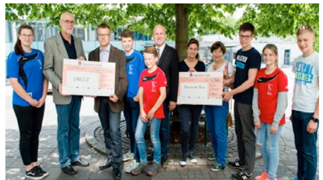
Scheckübergabe an UNICEF und Herzen für eine Neue Welt e.V.

Runde um Runde rannten die Schüler der Winfriedschule Fulda bei ihrem Sponsorenlauf im Schloßgarten der Barockstadt. Im Vorfeld hatten sie eigene Sponser und Sponsoren aquiriert, die dann jede gelaufener Runde monetär ehrten. Dabei kamen insgesamt 8.400 Euro zusammen, die die Schüler zu gleichen Teilen an UNICEF und Herzen für eine Neue Welt e.V. überreichten. Wir sind beeindruckt und dankbar für die eigenständigen Leistungen der Schüler.