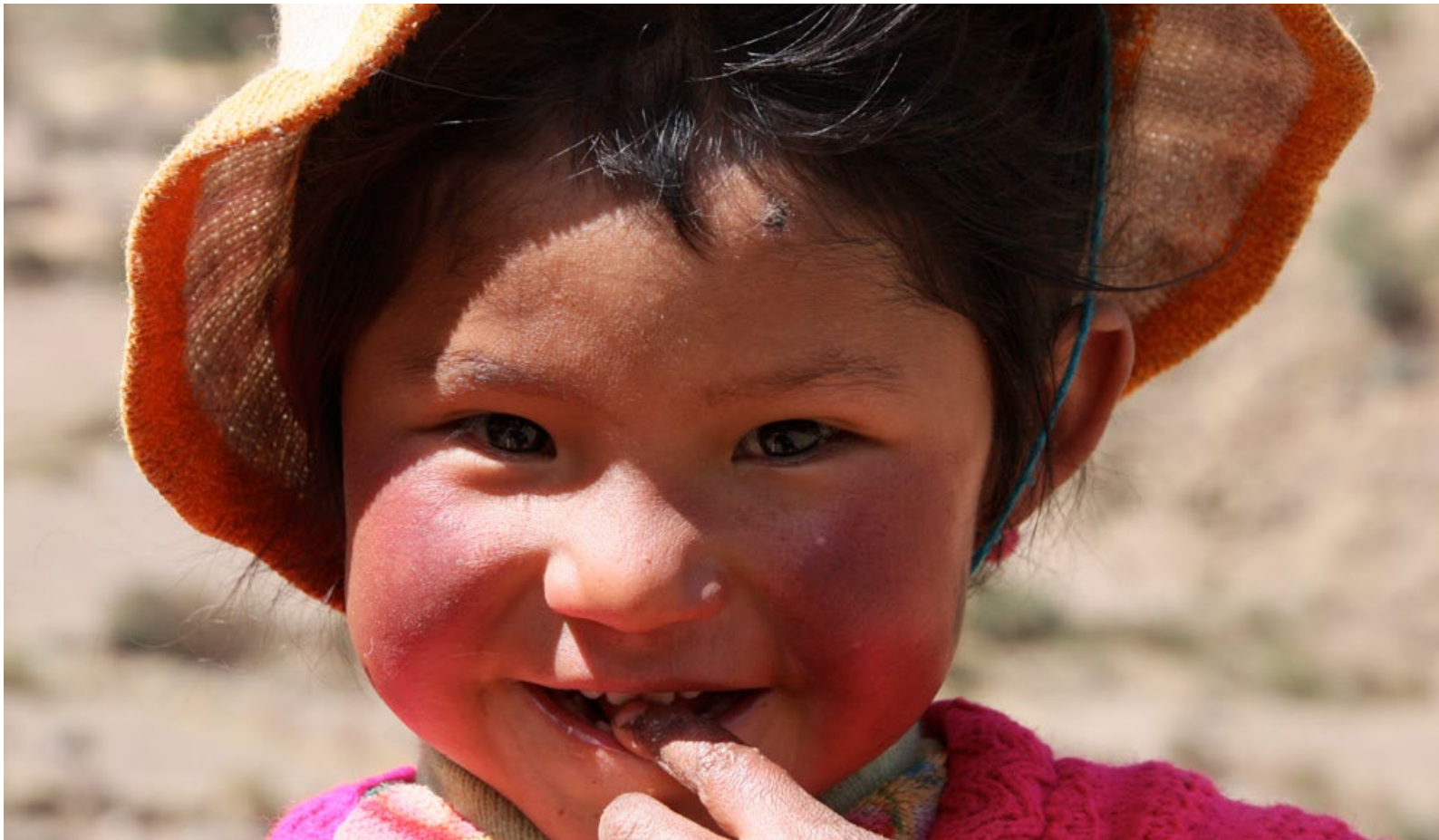
Mädchen aus dem Bergdorf Huilloc