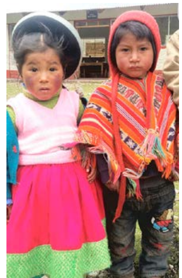
Kinder aus dem Bergdorf Chupani

Ihr Team von Herzen für eine Neue Welt e.V.