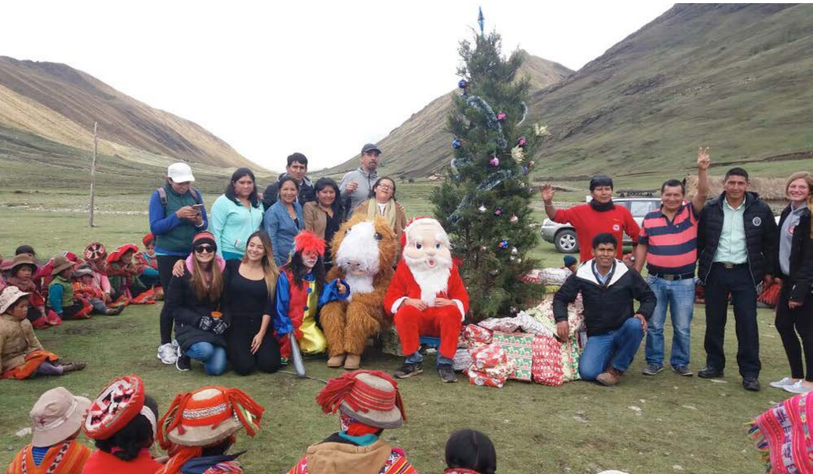
Weihnachtsfeier im Bergdorf Chupani