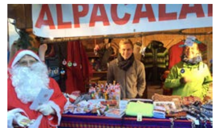
Stand am Weihnachtsmarkt

In diesem Jahr waren die Temperaturen deutlich weihnachtlicher als im letzten Jahr und die Besucher des Königsteiner Weihnachtsmarktes konnten die winterliche Stimmung sichtlich genießen. Dank vieler fleißiger Helfer/innen und zahlreicher Besucher und Interessenten war unser Stand ein voller Erfolg, wofür wir uns auch an dieser Stelle herzlich bedanken.