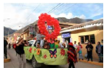
Wagen beim Festumzug