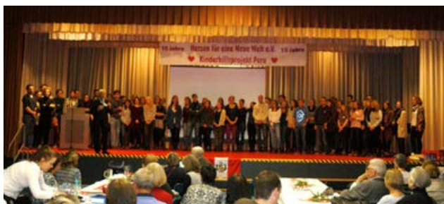
Zukünftige und ehemalige Freiwillige mit dem Vorstand